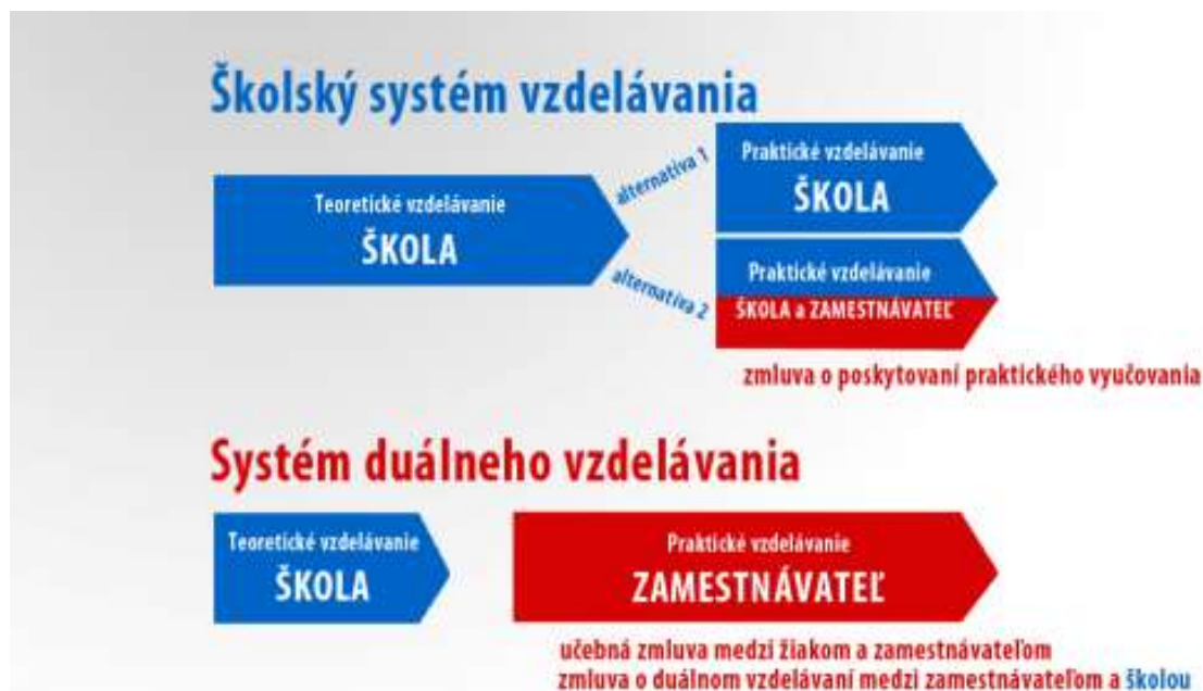
Schéma odborného vzdelávania a prípravy v strednej odbornej škole:

Kto rozhoduje, či sa bude odborné vzdelávanie a príprava žiaka na povolanie uskutočňovať systémom školského vzdelávania alebo systémom duálneho vzdelávania?