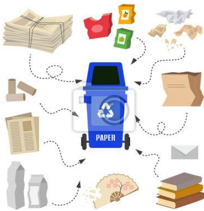
drewno na papier