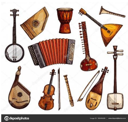
drewno na instrumenty