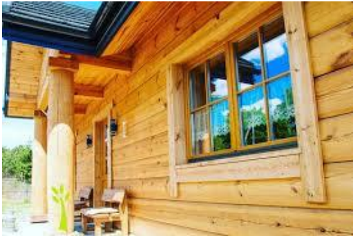
Drewno na dom

Jeśli masz mało pomysłów przyglądnij się obrazkom.