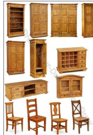
drewno na meble