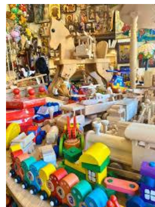
drewno na zabawki